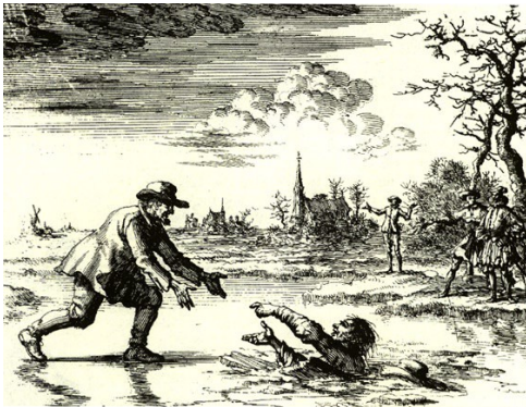
Illustration von Jan Luyken im Märtyrerspiegel: Dirk Willems rettet seinen Verfolger, der ihn dann dem Scheiterhaufen übergibt